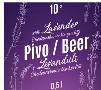
LEVANDULOVÉ PIVO S LEVANDULÍ CHODOUŠKOU

ORGANIC WILD CHERRY IN DARK CHOCOLATE WITH LAVENDER CHODOUNSKA