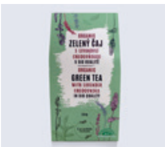
ORGANIC ZELENÝ ČAJ S LEVANDULÍ CHODOUŠKOU

ORGANIC GREEN TEA WITH LAVENDER CHODOUNSKA