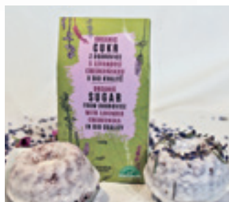
ORGANIC CUKR S LEVANDULÍ CHODOUŇSKOU

ORGANIC SEASALT WITH LAVENDER CHODOUNSKA