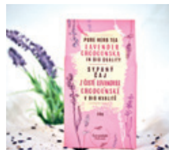
ORGANIC ČISTÝ SYPANÝ LEVANDULOVÝ ČAJ Z LEVANDULE CHODOUŠKÉ

ORGANIC VITAFRUIT TEA WITH LAVENDER CHODOUNSKA