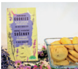
ORGANIC SUŠENKY S LEVANDULÍ CHODOUŇSKOU

ORGANIC THYME WITH LEMON GRAS AND LAVENDER CHODOUNSKA