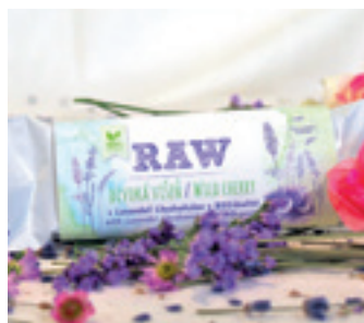
ORGANIC RAW VIŠŇOVÁ S LEVANDULÍ CHODOUŠKOU

ORGANIC STRAWBERRY RAW WITH LAVENDER CHODOUNSKA