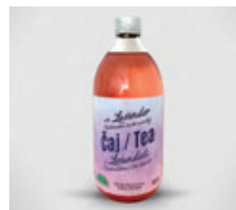
ORGANIC LEVANDULOVÝ STUDENÝ ČAJ S LEVANDULÍ CHODOUŇSKOU

ORGANIC LEMONADE FROM LAVENDER CHODOUNSKA