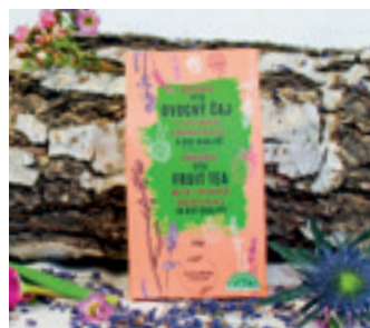
ORGANIC VITA FRUIT ČAJ S LEVANDULÍ CHODOUŠKOU

ORGANIC EARL GREY WITH LAVENDER CHODOUNSKA