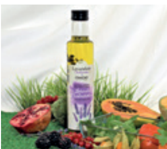
EXTRA VIRGIN OLIVOVÝ OLEJ S LEVANDULÍ CHODOUŠKOU

EXTRA VIRGIN OLIVE OIL WITH LAVENDER CHODOUNSKA