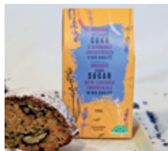
ORGANIC TŘTINOVÝ CUKR S LEVANDULÍ CHODOUŇSKOU

ORGANIC CANE SUGAR WITH LAVENDER CHODOUNSKA