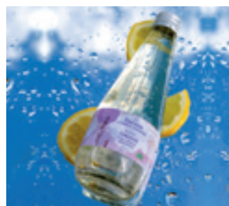
ORGANIC LIMONÁDA Z LEVANDULE CHODOUŇSKÉ

ORGANIC LAVENDER WATER WITH LAVENDER CHODOUNSKA