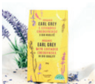
ORGANIC EARL GREY S LEVANDULÍ CHODOUŠKOU

ORGANIC GREEN TEA WITH LAVENDER CHODOUNSKA