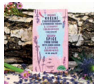
ORGANIC ČESKÁ MATERIĐOUŠKA S CITRONOVOU TRÁVOU A LEVANDULÍ CHODOUŇSKOU

ORGANIC CANE SUGAR WITH LAVENDER CHODOUNSKA