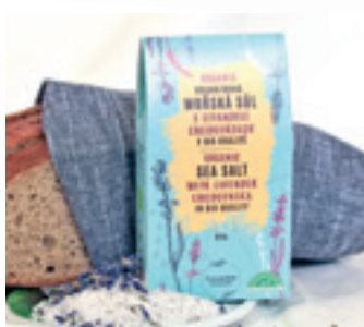
ORGANIC HRUBOZRNÁ MOŘSKÁ SŮL S LEVANDULÍ CHODOUŇSKOU

ORGANIC SEASALT WITH LAVENDER CHODOUNSKA