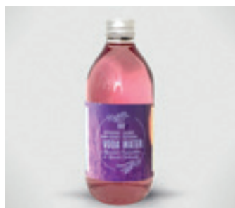
ORGANIC LEVANDULOVÁ VODA S LEVANDULÍ CHODOUŇSKOU

ORGANIC COOKIES WITH LAVENDER CHODOUNSKA