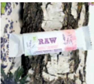
ORGANIC RAW JAHODOVÁ S LEVANDULÍ CHODOUŠKOU

ORGANIC PURE LAVENDER HERB TEA FROM LAVENDER CHODOUNSKA