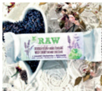
ORGANIC RAW VIŠŇOVÁ V HOŘKÉ ČOKOLÁDĚ S LEVANDULÍ CHODOUŠKOU

ORGANIC WILD CHERRY WITH LAVENDER CHODOUNSKA